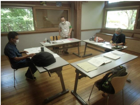
スタッフの採点作業：記述式の採点は難しい

採点希望者の答案について運営スタッフが採点しました。配点及び記述式解答の採点基準を「FIT友の会」独自に設定して採点しました。採点を担当したスタッフから模擬試験終了後に「頭で覚えたことを手で書く練習をする」「易しい問題から着手し全問回答できるように時間配分を工夫する」「300字記述はキーワードを押さえてできるだけ升目をうめる」などのアドバイスを頂きました。9/27の試験まで後1ヶ月。合格目指して、焦らず慌てず計画的に学習を続けて頂きたいと思います。