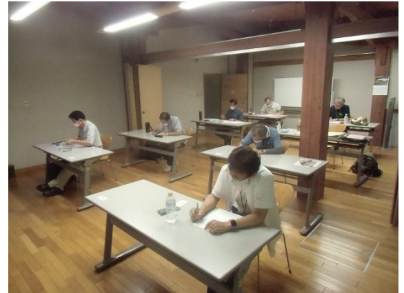
模擬試験：400字の記述解答に挑戦

午前中は「林業」11問80分と「野外活動」9問60分です。昼食後は「森林」11問80分と「安全及び教育」9問60分です。最近400字の記述問題が出題されるようになったので、その400字記述解答する問題にも挑戦しました。