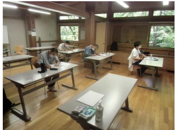
間隔を広くして感染防止