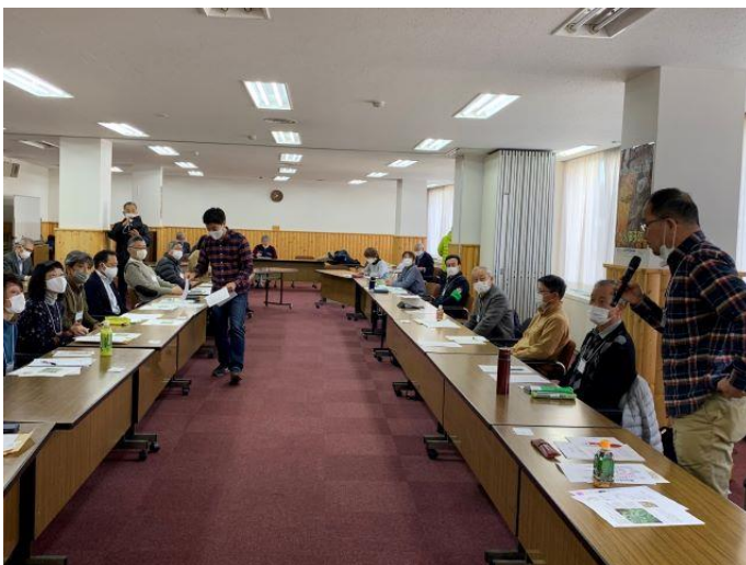
初顔合わせの「ニレの会」のメンバー