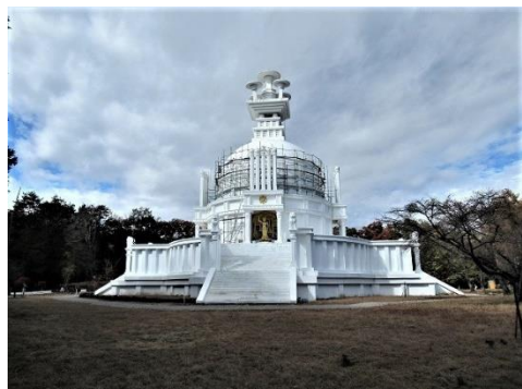
大寺山山頂の謎めいた仏舍利塔

深山橋から大寺山へ登り、謎めいた仏舍利塔を見学し、雲取山・石尾根などの展望を楽しみながら、鹿倉山まで縦走。最後は大丹波峠から県道18号線の今川分岐まで下山。そこからタクシーで丹波山温泉へ移動。希望者はのめこい湯に入浴。