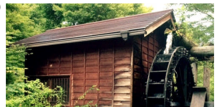
びりゅう館の水車小屋

開催日:5月21日(木) 延期予備日5月26日(火) 集合:JR中央線上野原駅 8時(8時30分発のバスに乗ります) 解散:JR中央線上野原駅 15時半頃(学校前バス停で 14時43分に乗車) 行程:JR上野原駅=ハツ田バス停~坪山~紅葉スポット~ 日置(ひおき)の里びりゅう館~学校前バス停 ★グレード:★★★★☆、累積標高差登り560m、下り560m、 コース定数15、歩行 距離5km、歩行時間約4時間 (注:本企画は、ゆっくり対応です。)