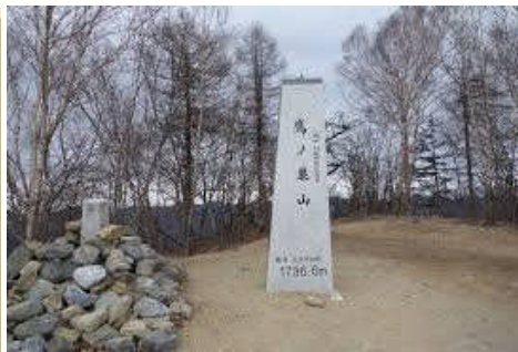
3大急登を終えると山頂だ