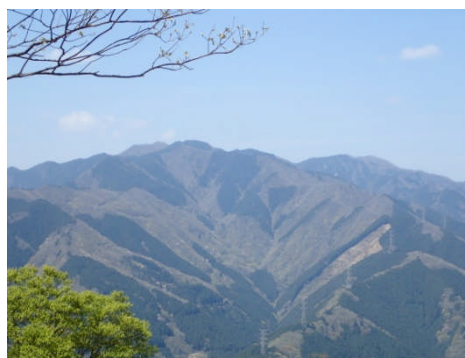
岩茸石山からの川苔山