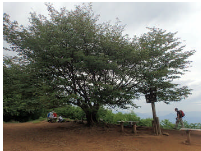
山頂のシンボルツリーは何の木