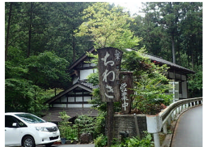
「ちわき」で和んで帰るもよし