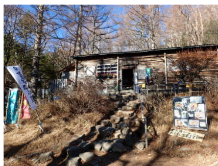
富士見平小屋の休憩もいい