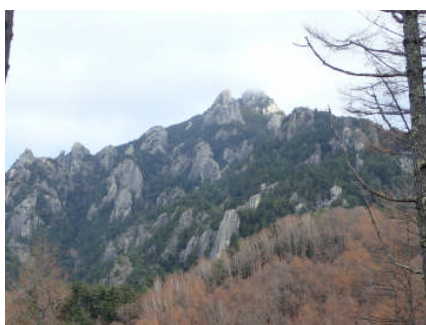
瑞牆(みずがき)山の奇岩

大海原に突き出した船のへさきのような大岩の頂上からの眺めは実に広大だ。葦崎駅に下りたら、すぐに南アルプスと八ヶ岳の大展望が待っている。標高が上がるにつれて迫力が大きくなる。山頂に上がるとさらにテンションが上がる。6月中はシャクナゲもきれいだ。下りは富士見平小屋でビールを飲むのも楽しい。バスを途中下車して増富の湯に入るのもいいだろう。岩を歩くのが好きな人には外せないハイキングだ。(健脚向け～岩場があります。)