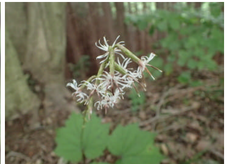
オクモミジハグマ