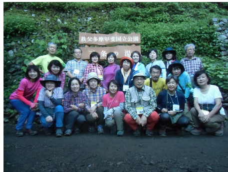
三条の湯で集合写真(2017年)