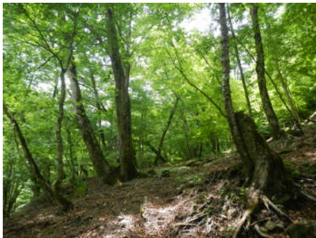
野陣尾根のブナの森

森林インストラクターと一緒に雲取山に登りませんか。鍾乳洞バス停から日原林道に入り、ブナ林の美しい野陣尾根を歩いて小雲取山を目指します。2日目は雲取山に登り、セツ石山を經由して鴨沢に下山します。コメツガ・シラビソなど亜高山帯の樹木や夏の草花、および東京の最高峰からの景色を楽しみます。