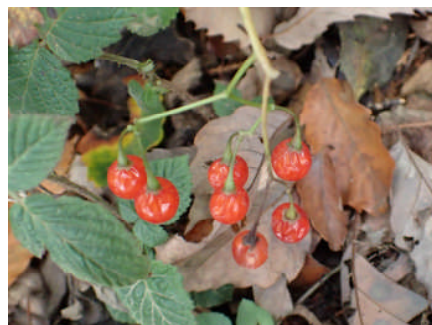
ヒヨドリジョウゴ