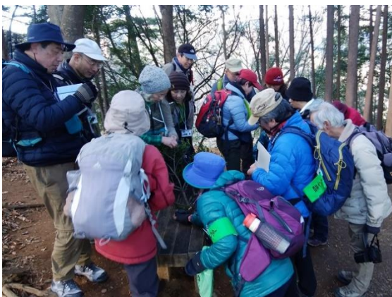
観察2：マツグミの実は潰すとベタベタです