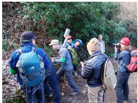
観察3：氷の華シモバシラはこうしてできます