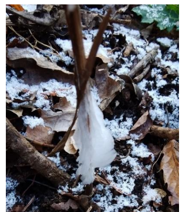
シモバシラの白い氷の華