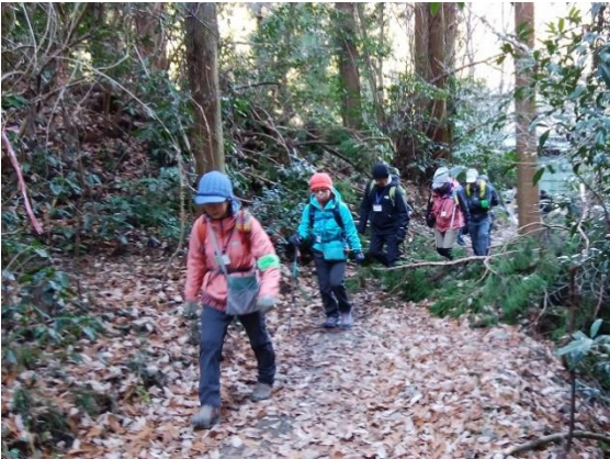
災害の跡：スギの倒木を越えて