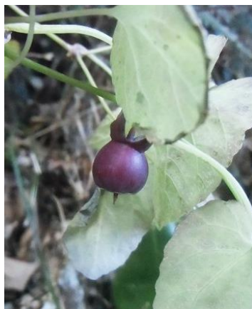
ツルギキョウの赤い実