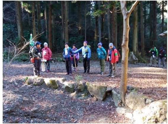
災害の跡：土砂に埋まった池