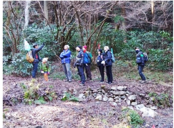
観察1：ヤマナシは秋に実が落ちてきます