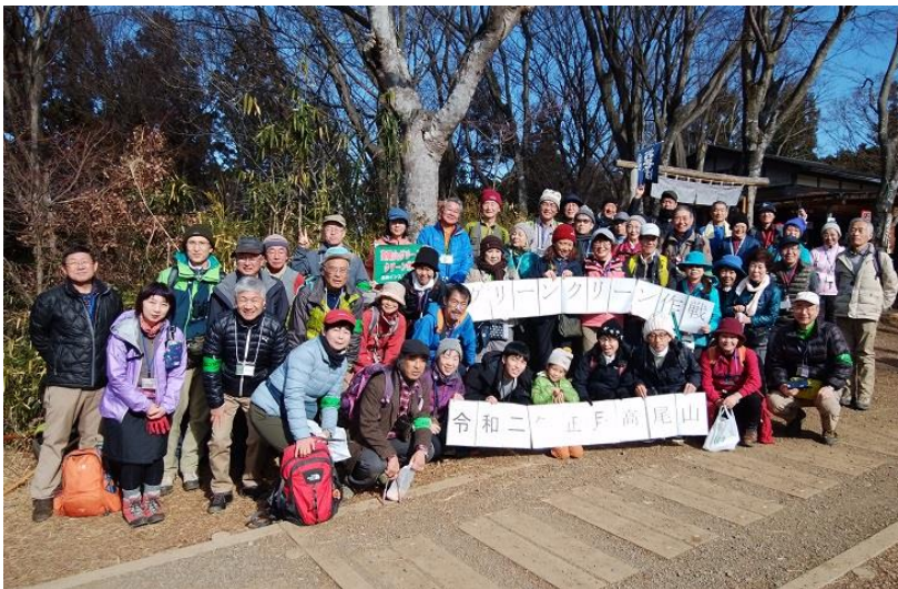
集合写真：「令和二年正月高尾山」のタイトルを掲げて

スタッフへの苦勞のご褒美として、その1)～その5) 全て観察することが出来ました。参加者全員でご褒美のお裾分けです。山頂では、白いコートをまとったきれいな富士山と、途中の山頂付近でシモバシラを見ることが出来ました。また、午前の観察会、午後のゴミ拾い、一日を通して無風で過しやすい日でした。